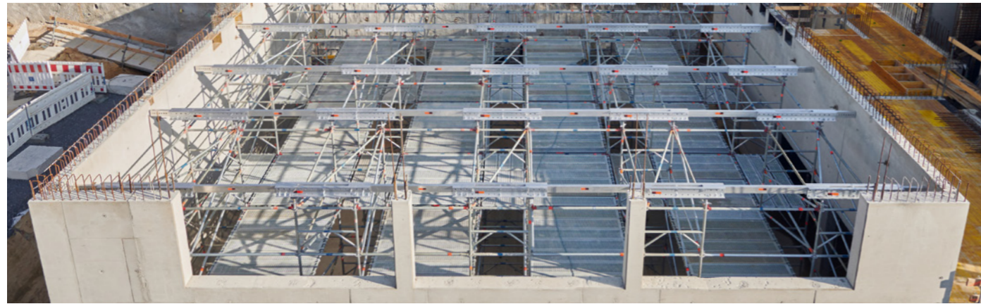
Auf der bauma stellte Layher den Aluminium-Träger TwixBeam vor. Bauunternehmen profitieren von der Systemlösung gleich mehrfach. Die Innovation besitzt eine hohe Tragfähigkeit, ist trotzdem leicht und bietet vielfältige Einsatzmöglichkeiten: von weit gespannten Arbeitsplattformen bis hin zu Systemjochträgern im Traggerüstbau.

GÜGLINGEN-EIBENSBACH. Für das Betonieren einer Flachdecke mit 42 cm Deckenstärke war eine mehr als 200 m 2 große und rund 6 m hohe Schalungsunterstützung erforderlich. Angesichts des engen Zeitfensters suchte das Besigheimer Bauunternehmen Karl Köhler nach einer effizienten und dem neuen, zugleich flexiblen und sicheren Lösung. Die Kombination aus Allround Traggerüst TG 60 und dem neuen Aluminium-Träger TwixBeam von Layher als als Systemjochträger erlaubte sowohl eine termingerechte Montage als auch die Umsetzung aller Baustellenanforderungen – im System.