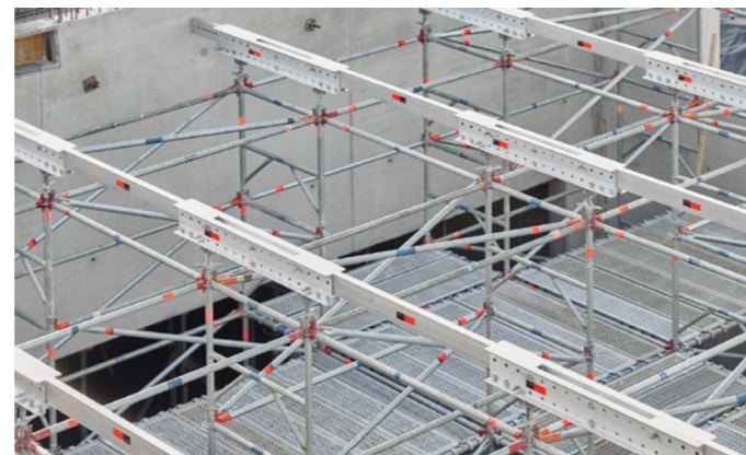
Großes und damit materialsparendes Raster, optimale Geometrie Anpassung am Randbereich und Integration von Arbeitsebenen: die Kombination aus Allround Traggerüst TG 60 und der Layher Innovation TwixBeam im Einsatz als Systemjochträger überzeugte beim Erweiterungsbau einer Gemeindehalle. Die Systemlösung erlaubte ermöglichte sowohl eine termingerechte Montage als auch die Umsetzung aller Baustellenanforderungen mit Serienbauteilen.

Mit dem neuen Aluminium-Träger TwixBeam stellte der Systemgerüstspezialist auf der bauma 2022 eine hochtragfähige und vielseitig einsetzbare Lösung vor. Die Innovation besteht aus zwei 200 mm hohen, gelochten Aluminium-U-Profilen, die miteinander verschraubt werden. Erhältlich ist der TwixBeam in den Längen 0,80 bis 6,60 m. Leichte Einzelteile aus Aluminium und die Zerlegbarkeit beschleunigen die Montage und erleichtern den Einsatz auch bei engen Platzverhältnissen. Die Anwendungsvielfalt reicht von klassischen Abfangträgern und Hängegerüsten bis hin zum Einsatz als Systemjochträger in Verbindung mit dem Allround Traggerüst TG 60. Durch die hohe Tragfähigkeit des TwixBeams im Vergleich zu Holzträgerschalungen lassen sich Traggerüste hinsichtlich Lastabtrag, Materialeinsatz und Montageaufwand maßgeblich optimieren. In der Folge sind weniger Traggerüsttürme nötig. Dies spart Zeit bei Transport sowie Montage und Demontage.